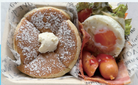
パンケーキ ランチBOX ¥990