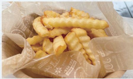
選べるフレーバーポテト ¥440 塩レモン・ポルチーニ香るきのこ・バター醤油