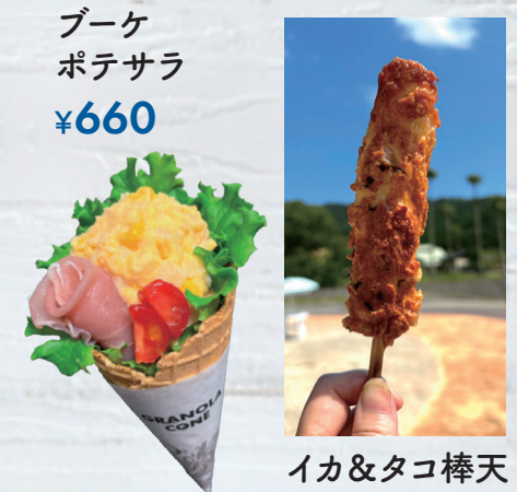
ブーケ ポテサラ ¥660