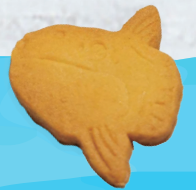
マンボウクッキー 5個入り ¥990