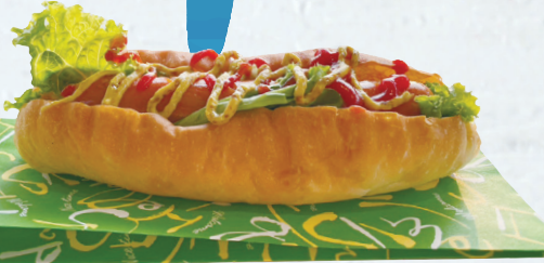
地元ブレジャンのパンを使った ホットドック ¥480 地魚フィッシュドック ¥550