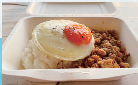
フレッシュメントを 使ったガパオライス ¥770