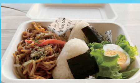
おにぎり&焼きそば ランチBOX ¥660