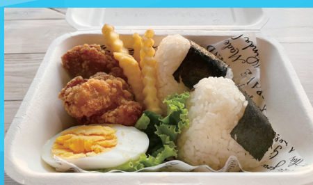
おにぎり&唐揚げ ランチBOX ¥660