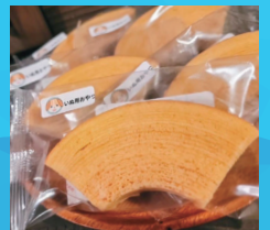
ワンコバーム クーヘン ¥550