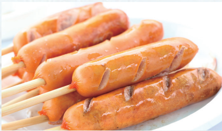
フランクフルト 1本 ¥330